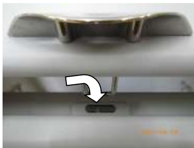
写真3：定期交換部品